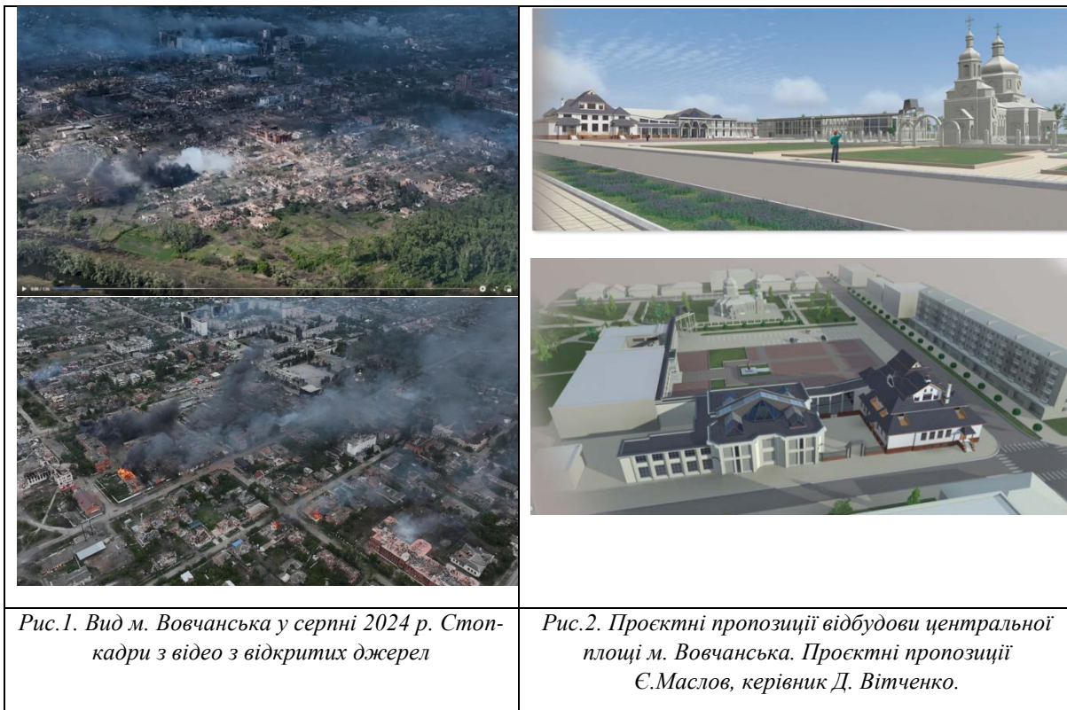
Рис.1. Вид м. Вовчанська у серпні 2024 р. Стоп-кадри з відео з відкритих джерел