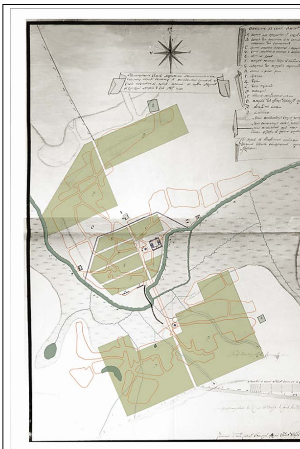
Рис. 3. «Геометричний план Харківського намісництва повітовому місту Вовчанську з вказуванням, старих та нових нанесених вулиць» губернського землеміра Густава фон Буксгевдена 1785 р. Колоризація та прорис сучасні (Новгородов, Кацанов та Вітченко, 2013).