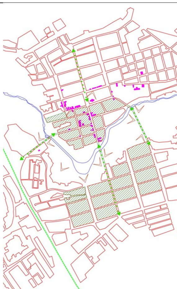
Рис. 4. Історичні квартали на сучасному плані. Вовчанська (Новгородов, Кацанов та Вітченко, 2013).

Центр міста знаходиться в низині долини ріки Вовча, в той час як південна і північна частини міста розташовані на підвищеннях. Найнижча точка має висоту 103 м, найвища – 130 м.